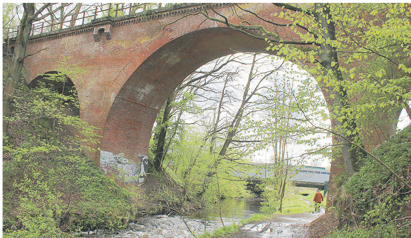
Blick in die Gegenwart: Durch den Bogen des alten Viadukts ist die moderne Estebrücke der A1 zu erkennen

geschichtlich sehr interessant.“ Das gelte sowohl für die Rundbogenform als auch für die Herstellung als komplett aus Ziegeln gemauertes Bauwerk. Deswegen habe der